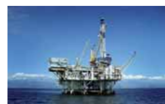
Óleo e Gás