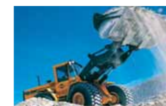
Fora de Estrada