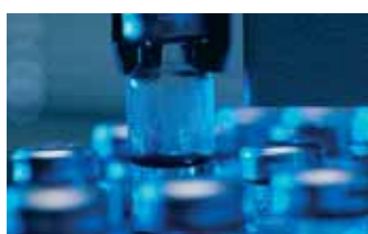
Processamento alimentício, farmacêutico e químico.