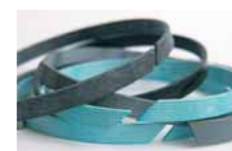
Buchas e mancais